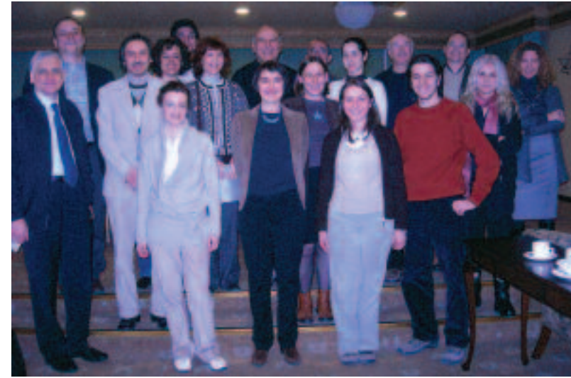
Design Turkey için ilk adımlar, first steps for Design Turkey, Danışma Kurulu toplantısı, Advisory Committee meeting

In 2005, under the coordination of the Undersecretariate of Foreign Trade, the Expotrain project was realized to promote Turkey and Turkish companies by railway on the track of the Silk Road for the "Silk Road Turkish Export Products Fair". ETMK realized the design of the TIM railway car of this project, where 16 Turkish companies had their separate railway cars.