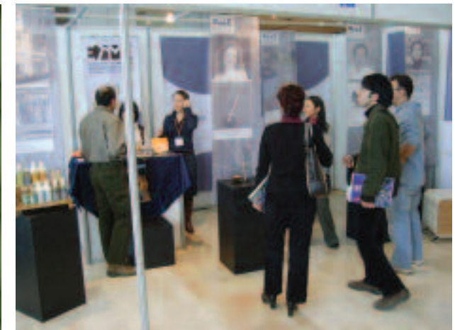
Kobif İzmir 2007, ETMK tasarım sergisi, ETMK design exhibition.